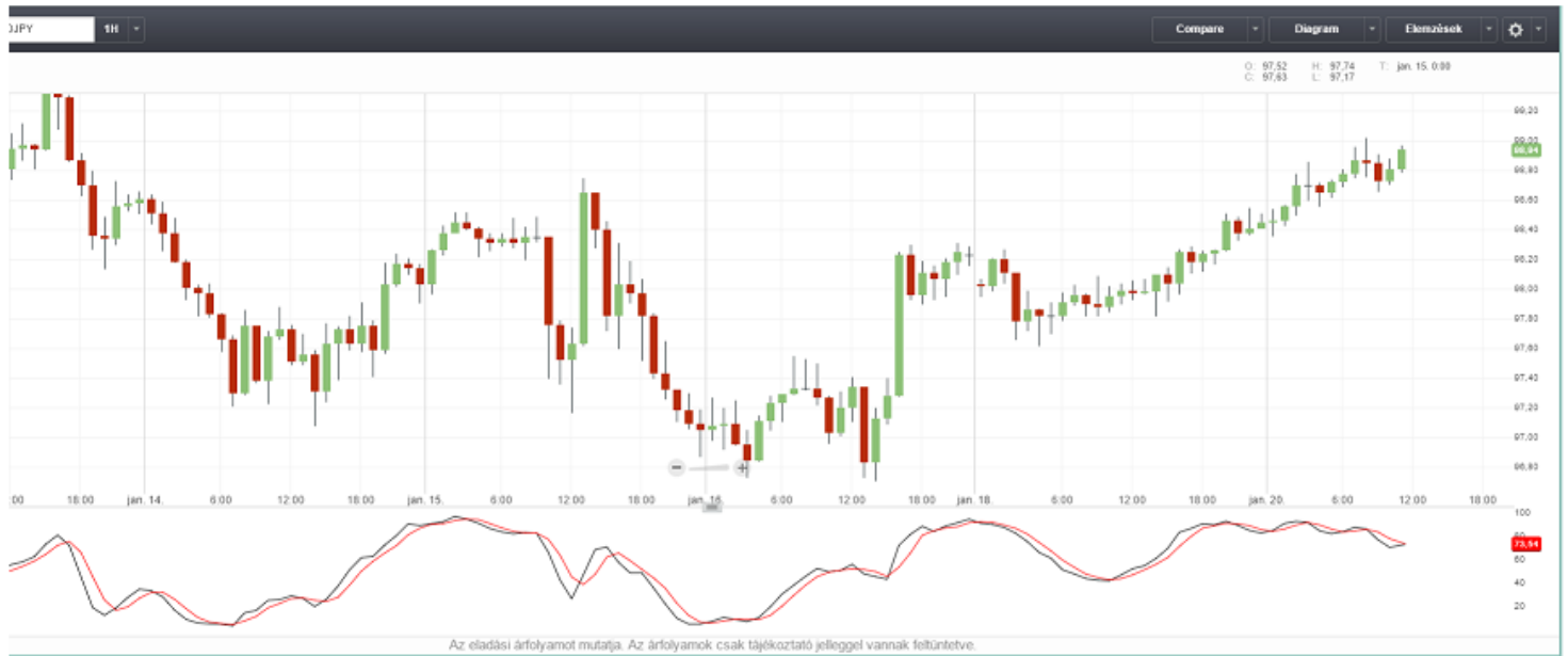
Diagram és elemzés

Mutatok egy ábrát, amin levezetem a jó kereskedést, és valami újat is. De előbb: a kép jobb felső részén látható a Diagram, és az Elemzések fül, amikről korábban beszéltem. Amikkel beállíthatod, mit láss. Az oldalak húzásával pedig az ablak nagyságát a szemedhez, és a felfogó, azaz átlátó képességedhez igazíthatod. Figyelem! A legtöbb esetben az ablak tartalmát frissíteni kell! Az ablak általában a megnyitás idejének állapotát mutatja. Újra húzd le az időbeállítót, és kattints az időre, amin jelenleg áll. Így frissít. Jó sokszor becsapott, hogy azt hittem, stagnál.